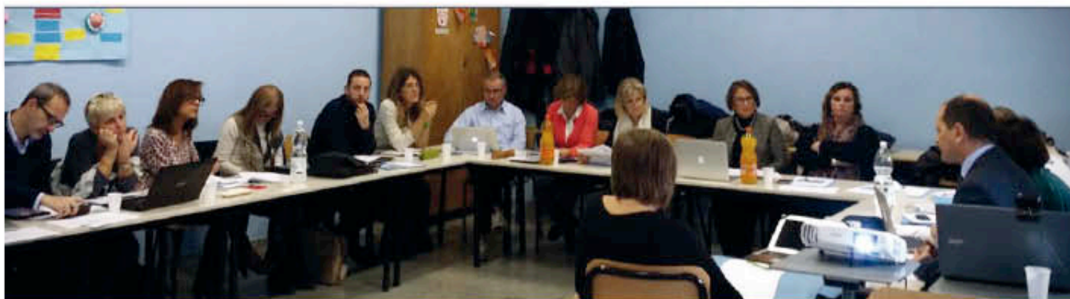
Riunione di Rete Dialogues, IC Settembrini Roma, 12 novembre 2015

È a disposizione un HELP DESK TECNICO che risponde ai quesiti, chiarisce dubbi ed eventuali incertezze, risolve problemi, supporta l'iscrizione degli alunni alla piattaforma Face to Faith (corso team blogging) e collabora per la messa a punto del setting tecnico della videoconferenza. helpdesk@retedialogues.it