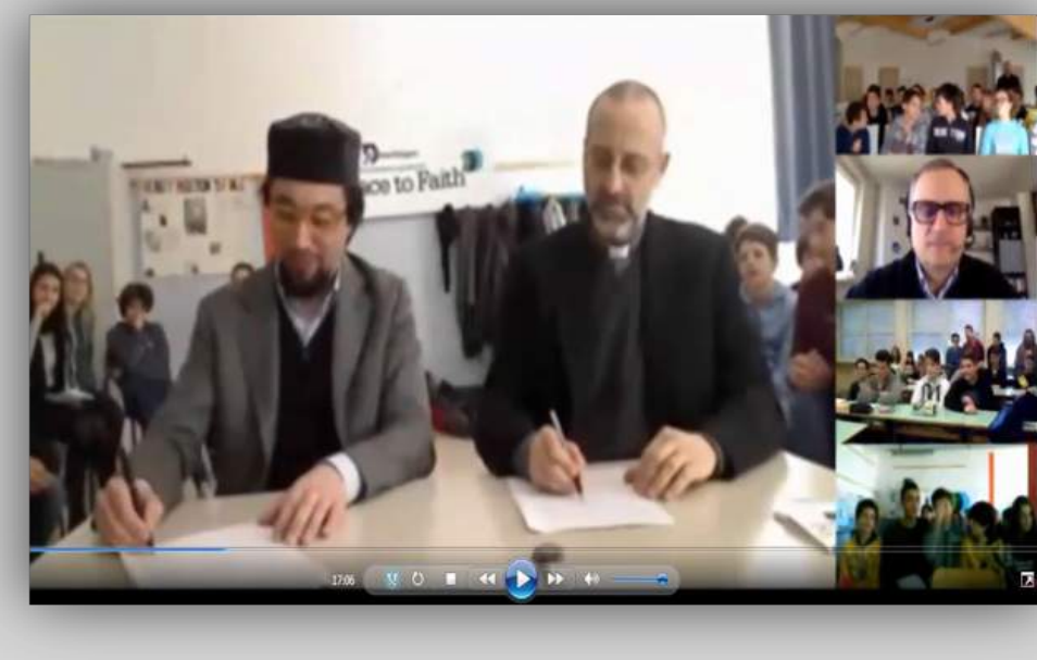
Video conferenza "Guerra e pace"