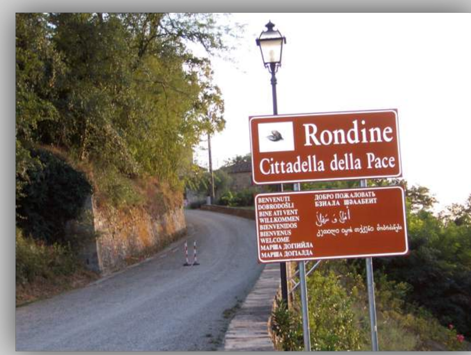
Visita a Rondine – reportage fotografico