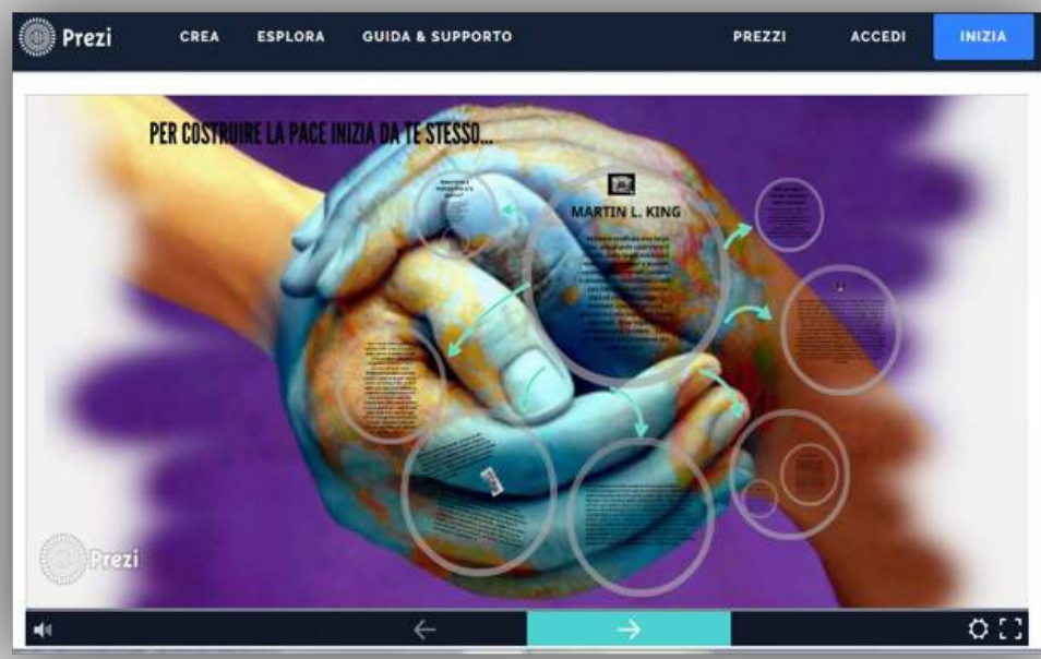
Elaborazione di un testo con Prezi