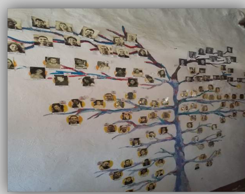
Visita a Rondine – reportage fotografico