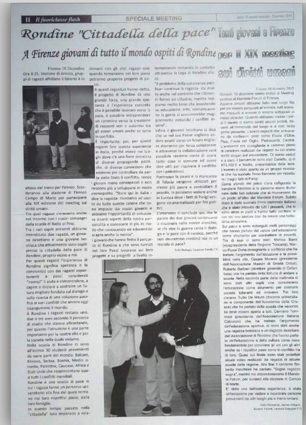
Articolo per il giornalino d'istituto

Dialogo e didattica della scrittura nell'epoca digitale